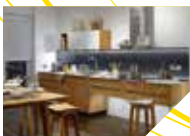
Sichere Elektrogeräte und gutes Licht