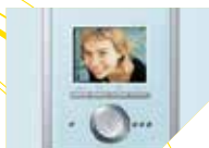
Zutrittskontrolle und Videoüberwachung