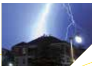
Blitz- und Überspannungs- schutz für Hifi und PC