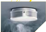
Rauchwarnmelder, Bewegungs- und Präsenzmelder